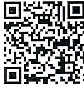
ลุ่มน้ำโขงเหนือ