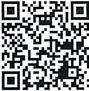
ลุ่มน้ำปิง