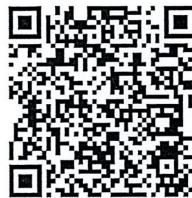
QR Code รายชื่อ อปท. ในเขตลุ่มน้ำ