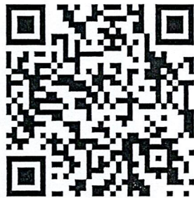
QR Code ขอบเขตพื้นที่ลุ่มน้ำ ตามพระราชกฤษฎีกากำหนดลุ่มน้ำ พ.ศ. ๒๕๖๔