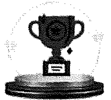
รางวัลชมเชย