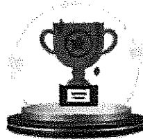
รางวัลรองชนะเลิศอันดับ 2

โลรางวัลจากรัฐมนตรีว่าการ กระทรวงมหาดไทย