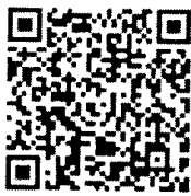
QR Code ตรวจสอบข้อมูล