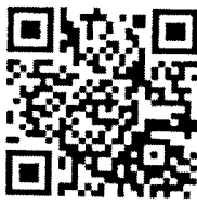
QR Code รายงานข้อมูล