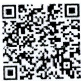
QR Code สิ่งทีส่งมาด้วย