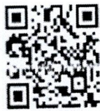
QR Code แบบฟอร์มส่ง แผนปฏิบัติงานประจำปี ๒๕๖๙