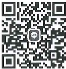
Line กลุ่ม “งานปภ. อปท. อต.”