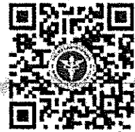
QR code ลงทะเบียน