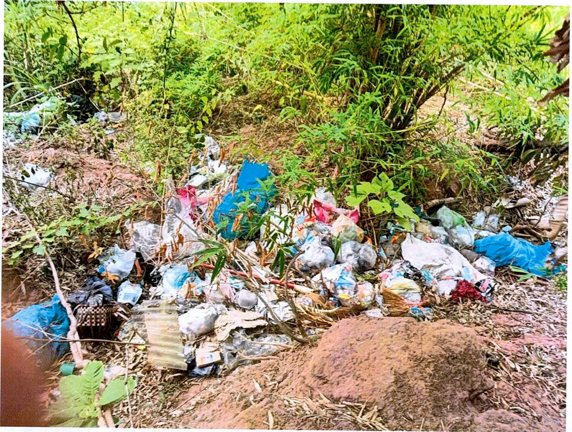
ภาพการลักลอบทิ้งขยะ ในเขตพื้นที่องค์การบริหารส่วนตำบลปากท่า