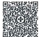
สแกนสมัครหลักสูตร ปฐมพยาบาล