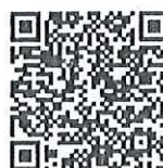
คำชี้แจง