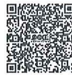
สแกนสมัครหลักสูตร ผู้บริหารงานยุวกาชาด