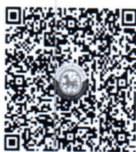
QR Code 1

ตรวจสอบจำนวนผู้ชำระค่าลงทะเบียนแต่ละรุ่น