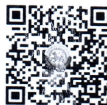
QR Code 2

ตรวจสอบจำนวนผู้ชำระค่าลงทะเบียนแต่ละรุ่น