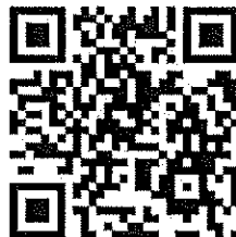
QR CODE เอกสารที่เกี่ยวข้อง