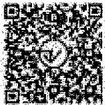
รายละเอียดผลการ การคัดเลือกผลงาน