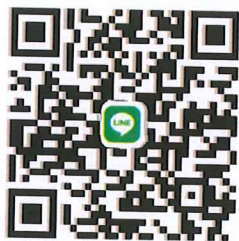
ไลน์กลุ่ม งานปภ. อปท. อต.